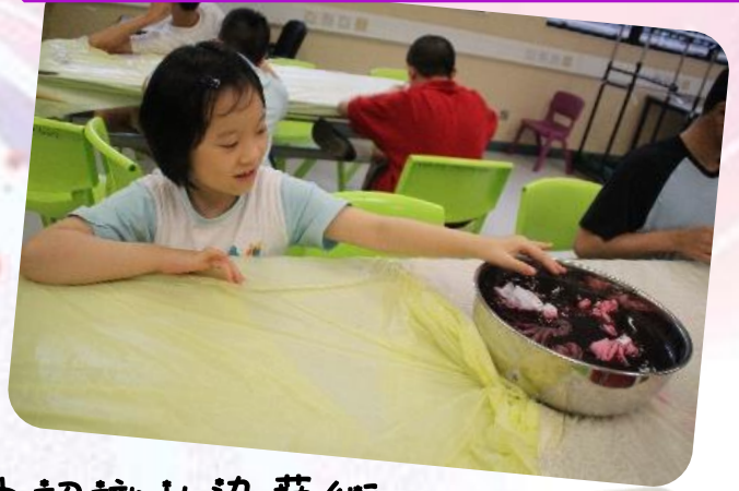
在七彩顏色中認識扎染藝術