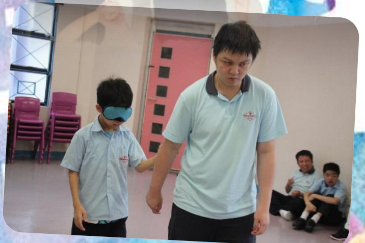
互相合作 彼此信任 解決難題